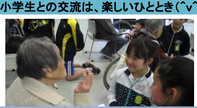
小学生との交流は、楽しいひととき(^v^)

ウエルフェア土岐老人デイサービスは、総合福祉センターの中にあり、地域の方とのふれあいも多く社会参加できるデイサービスです。利用者様は、運動や趣味活動を楽しまれ、毎日、笑顔で健康づくり、生きがいづくりをされています。