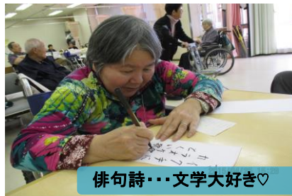
俳句詩・・・文学大好き♡