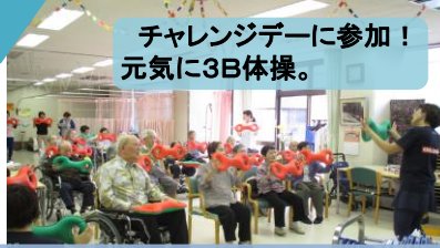
チャレンジデーに参加！ 元気に3B体操。