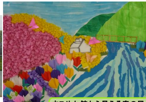
すこやか館から見える春の風景を作ってみました。

保健センターの3階にあるすこやかは、明るく元気いっぱいのデイサービスです。職員も利用者様も働き者で元気な笑い声と笑顔にあふれています！