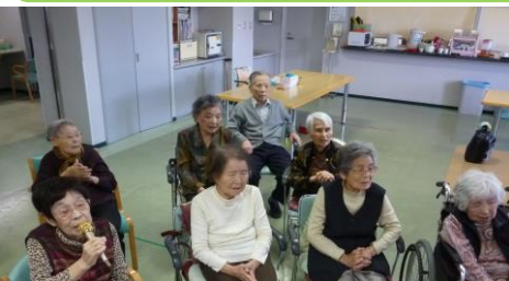
カラオケ 「どれにしようかな」「今日は何を歌おうかな」 美声と拍手が響き渡ります♪♪