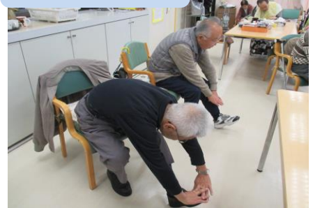
転倒予防体操はじめ。 いち・に・いち・に