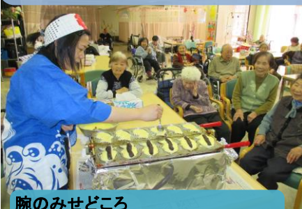
腕のみせどころ 美味しい焼きできあがり！！

ウエルフェア土岐老人デイサービスは、総合福祉センターの中にあり、地域の方とのふれあいも多く社会参加できるデイサービスです。利用者様は、運動や趣味活動を楽しまれ、毎日、笑顔で健康づくり、生きがいづくりをされています。