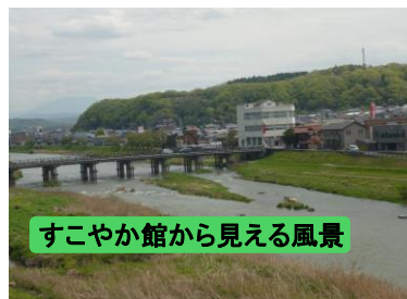
すこやか館から見える風景