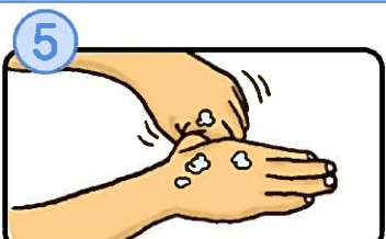
⑤ 親指と手のひらをねじり洗いします。