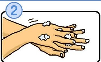
② 手の甲をのぼすようにこすります。