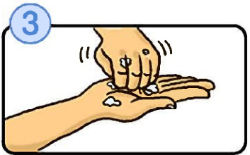
③ 指先・爪の間を念入りにこすります。