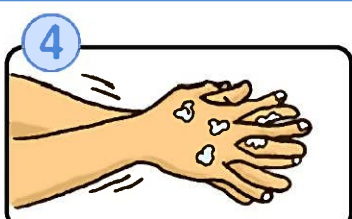
④ 指の間を洗います。