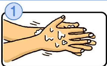
① 流水でよく手をぬらした後、石けんをつけ、手のひらをよくこすります。

気温が下がり、風邪やインフルエンザ、ノロウイルス等の感染症が増える季節です。感染症予防の基本は「手洗い」で、手に付着したウイルスを洗い流すことです。今回は「手洗い」についてご紹介します。