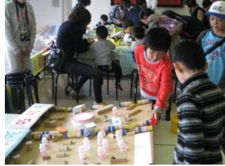
11月1日(土)2日(日) 「下石どえらあええ陶器まつり」 〈西部児童センター〉