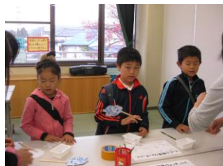
「フォーチュンクッキー踊ったよ」 「スカットボール何点入ったかな?」 「トトコ妖怪ウッチ」