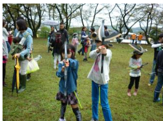
10月5日(日) 「高山城 戦国まつり」 〈土岐津児童館〉