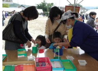
10月26日 「肥田公民館まつり」 〈肥田児童センター〉