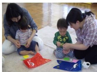
こいのぼりあそび 駄知児童センター