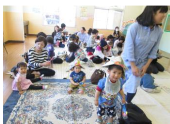
こいのぼりあそび 泉児童館