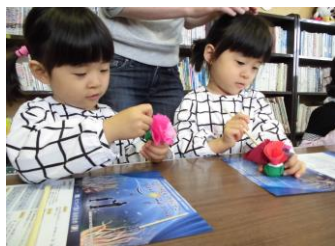
母の日のプレゼント作り 妻木児童館