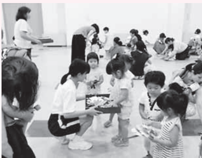
児童館での行事のお手伝い

『福祉』・『介護』ってなんだろう？ 施設ってどんなところ？ 普段できない体験と素敵な出会いが待っていました。一部をご紹介します。