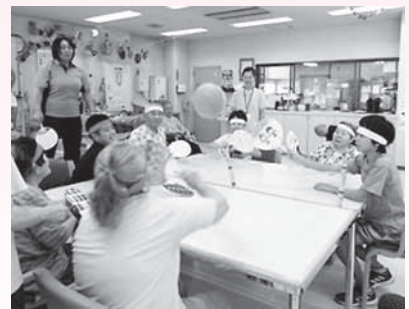
老人デイサービスでのふれあい