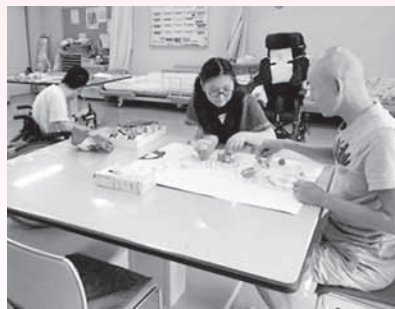
身体障害者デイサービスでの作業訓練