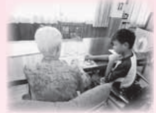
グループホーム和居和居

『福祉』・『介護』ってなんだろう？ 施設ってどんなところ？ 普段できない体験と素敵な出会いが待っていました。一部をご紹介します。