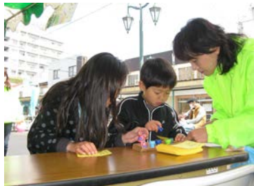
キラキラスタンプも押しました！