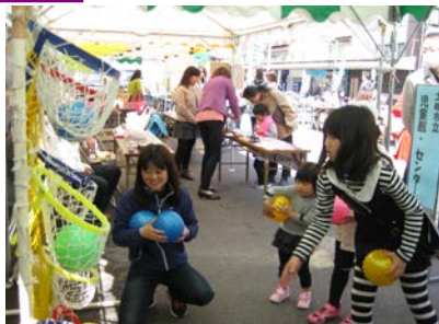
「ボールが何個入るかな？」