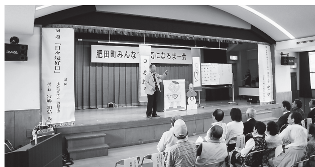
地区社協事業「肥田町みんな元気になるまー会」