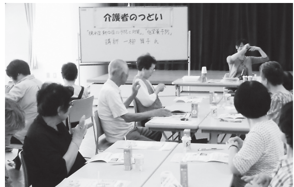
家族介護支援事業「介護者のつどい」