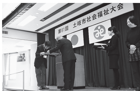
土岐市社会福祉大会