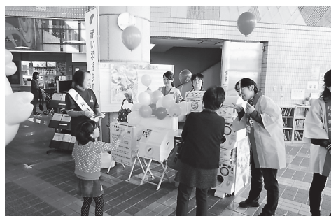
共同募金運動協力