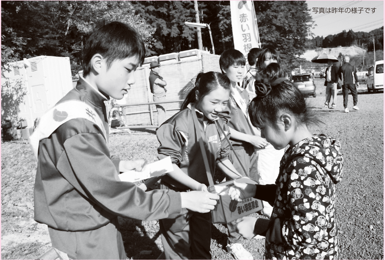
写真は昨年の様子です

このマークは社会福祉協議会の「社」を図案化し「手をとって明るいあわせな社会を建設する姿」を表現しています。