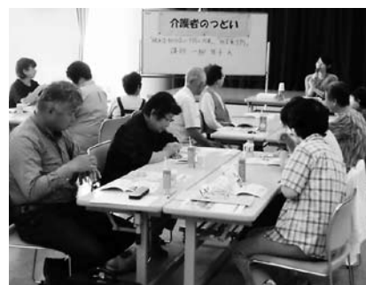
介護者の集い「熱中症予防等講座」