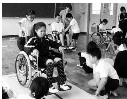
福祉体験学習「車イス体験」