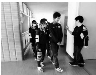
福祉体験学習「高齢者疑似体験」