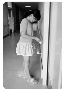
ウエルフェア土岐3階の点字シールを作りました!