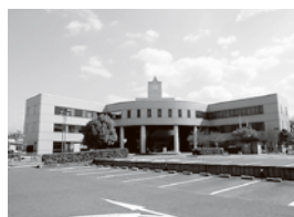
西部老人福祉センター 住所：下石町1060 電話：57-6661