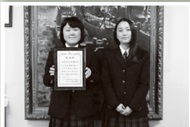
土岐紅陵高等学校