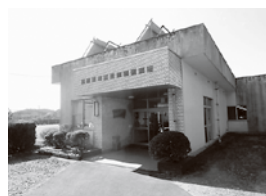
土岐市白寿苑 住所：駄知町2023-1 電話：59-1231