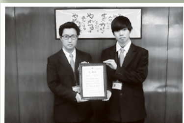
東濃フロンティア高等学校