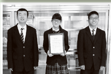
東濃特別支援学校