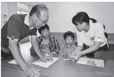
土岐津町社協「三世代ふれあい広場」