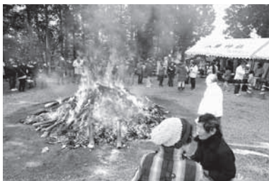
妻木町社協「三世代どんど焼き」