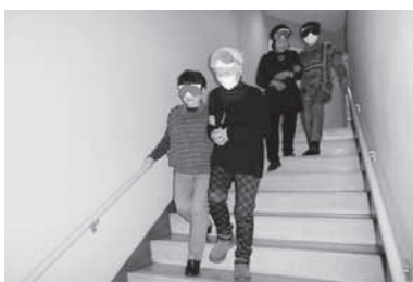
ガイドヘルプ講座