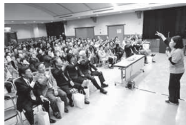
肥田町社協「肥田町みんなで元気になるまー会」