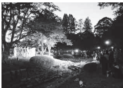
曾木町社協「ふれあいミニコンサート」