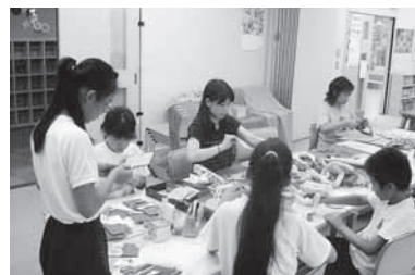
児童センターでの制作活動