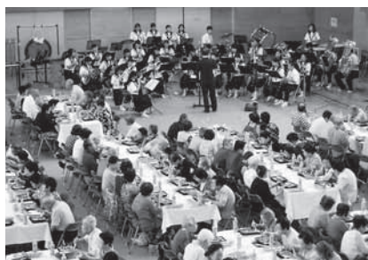
駄知町社協「駄知友愛の会」