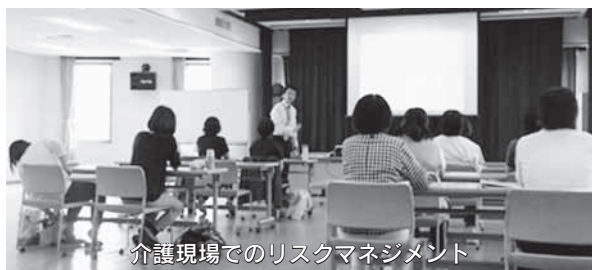
介護現場でのリスクマネジメント