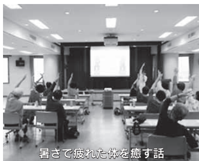
暑さで疲れた体を癒す話