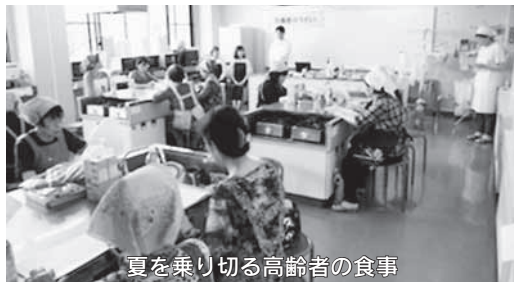
夏を乗り切る高齢者の食事

在宅介護でお困りの事、基本を学びながら情報交換をする場です。介護相談も随時、受付けています。