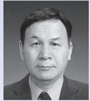
土岐市社会福祉協議会