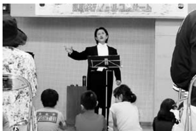
鶴里町社協「ほたる祭りコンサート」