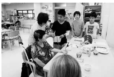
福祉学び塾(施設体験)