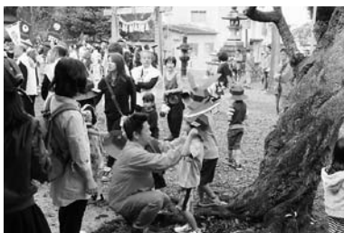
土岐津町社協「戦国合戦まつり 武者行列」