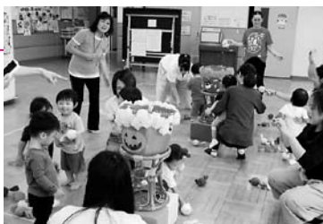
児童センター行事