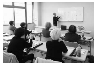
ボランティア養成講座