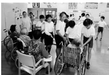
デイサービスでの施設交流