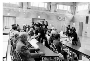
ふれあいいきいきサロン「泉が丘町ふれあいサロン」