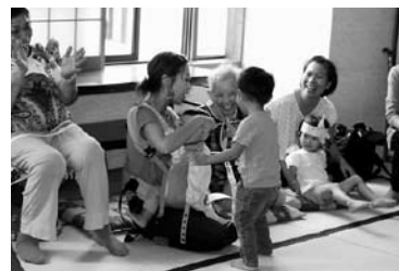
児童センター、老人センター交流事業