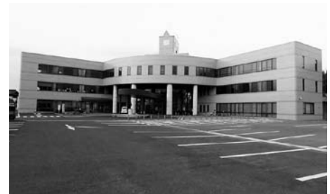
土岐市総合福祉センター・ウエルフェア土岐