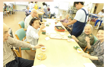
たこ焼きを作って食べました