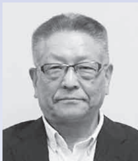
土岐市社会福祉協議会