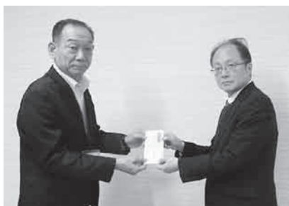
土岐市農業祭実行委員会