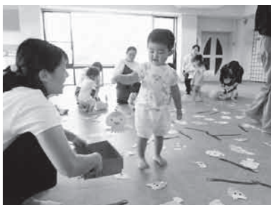
おさかなつりあそび