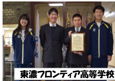
東濃フロンティア高等学校