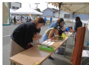
「妻木町文化祭」 妻木児童館