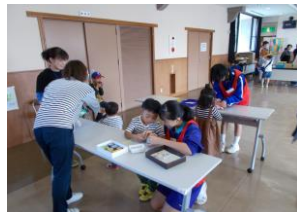
「肥田町公民館まつり」 肥田児童センター