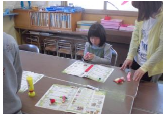
「母の日プレゼント作り」 妻木児童館