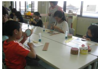
「スマイルプレゼント作り」 西部児童センター